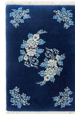
富貴唐草 size: 61×91cm 各種サイズ有り