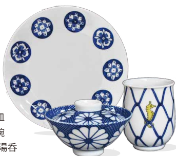
染付丸紋七寸皿 内外菊蓋付飯碗 タツノオトシゴ湯呑

江戸末期 (1841年)、飛騨高山陣屋郡代が始めた焼物で、久谷・有田・瀬戸等の手法を渾然一体とする独特の絵付けの伝統が、手作り手描きにより守り続けられています。素朴な中にも華麗さを秘めたその磁器は、現代も愛され使い続けられています。