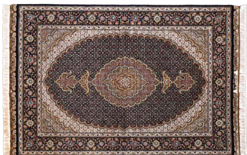
PERSIAN CARPET タブリーズ産 size: 150×105cm

起源は紀元前の古代ペルシャにまで遡り、16~17世紀当時から様々な地方で生産されていたことが、現在の多様なデザインを生み出す事につながっています。流通量が多く、品質管理も徹底されている「タブリーズ」「クム」「カシャン」「イスファハン」「ナイン」が5大産地といわれています。