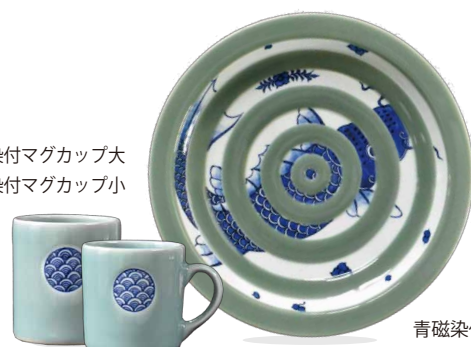
青磁染付鯉紋大皿