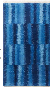
錠格子 size: 69×122cm 各種サイズ有り