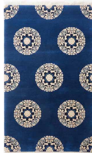
宝相華円紋 size: 91×152cm 各種サイズ有り

清・明朝時代の中国の伝統的な製法が、日本の伝統美を追究したデザインと出逢い、誕生したニヤローラン。天然の藍を蔵で醗酵させ、濃淡11種の藍色で染め上げています。